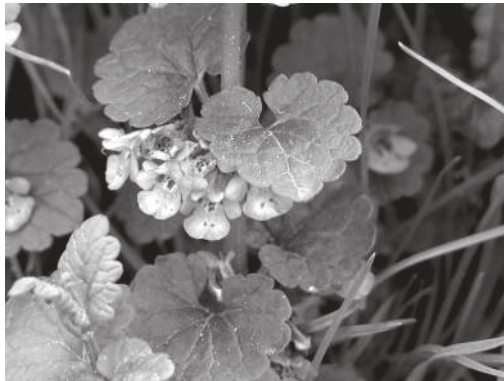
Hiedra terrestre ( Glechoma hederacea )